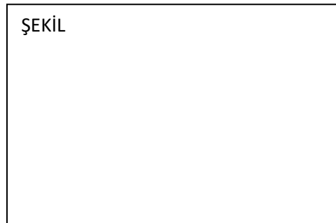
Şekil 4.2. Süleyman Demirel Üniversitesi Eczacılık Fakültesi Süleyman Demirel Üniversitesi Eczacılık Fakültesi (Tek Satır aralığı)